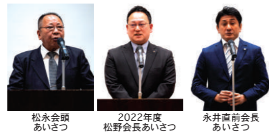
松永会頭 あいさつ 2022年度 松野会長あいさつ 永井直前会長 あいさつ