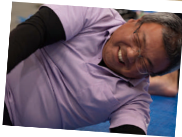
体操座り、 ニガテですう～