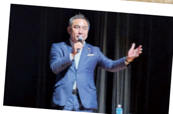
まちをどうしてか? 実例を交え、ご講演いただきました。