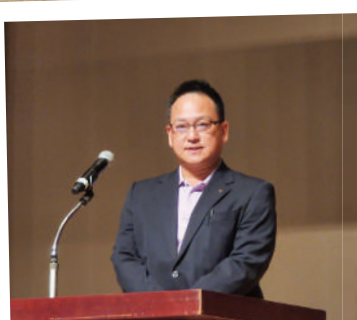
松野会長、ご挨拶 キッ