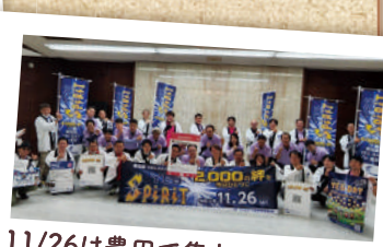
11/26は豊田で集まるぞー! オー!