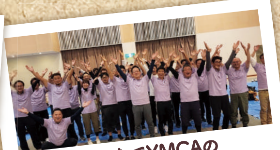
みんなでYMCAの リズムでYEG!!