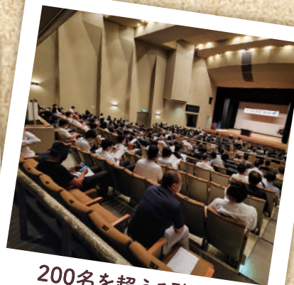
200名を超える聴衆者