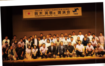
記念に講師を交えて集合写真!

会員数101名(9月13日役員会議現在)のうち、55名一般参加者160名(OB会員18名含む) 総計215名