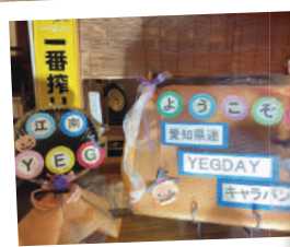
Well Come 江南!!

県連広報委員会 桑山委員長を始め、出向者の皆さんが県下21単会を隈無く、精力的にキャラバンしています。 10/11には江南の地にもお見えになり、単会としても熱くお出迎えしました♪