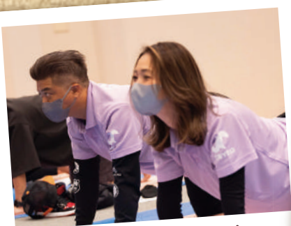
マスクの奥の表情は!