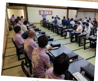
#懇親会 大勢で宴席を楽しみました